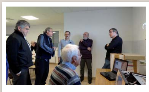
Une partie de l'assistance autour du HP-SDR.