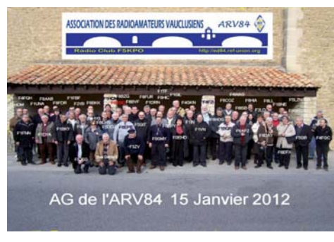
AG de l'ARV84 15 Janvier 2012

L'esprit OM de cette agréable journée a enchanté tous les participants, OM, YL, QRP.